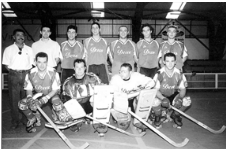
El conjunto ordense masculino se reforzó con tres jugadores para evitar el descenso

El otro equipo gallego que acudiría al campeonato de España es el Castrelos de Vigo, campeón de la Liga Norte en la temporada recién finalizada. Las ligas auto-